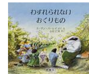
『わすれられない おくりもの』