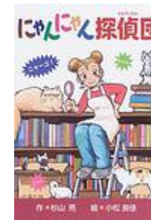
『にやんにやん探偵団』