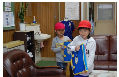
《1年生だけの学校探検》