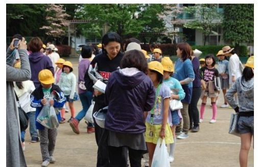
《避難 引き渡し・引き取り訓練》